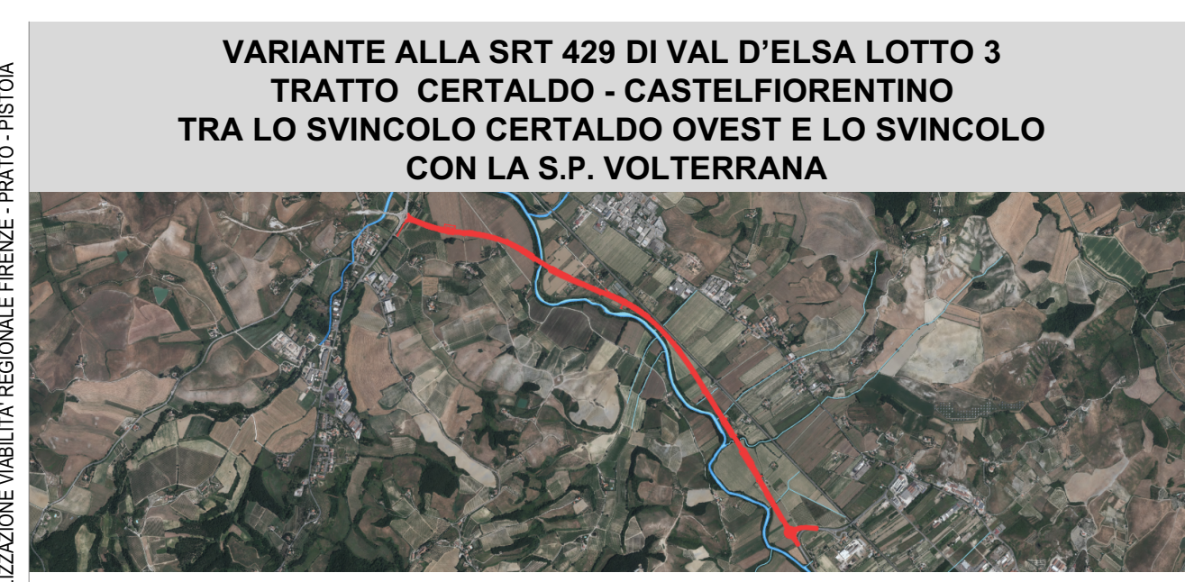
CARTELLA MA – STUDI E INDAGINI PER MITIGAZIONE AMBIENTALE E OPERE A VERDE

REGIONE TOSCANA ASSESSORATO INFRASTRUTTURE MOBILITÀ URBANISTICA E POLITICHE ABITATIVE DIREZIONE DELLE POLITICHE MOBILITÀ INFRASTRUTTURE E TRASPORTO PUBBLICO LOCALE SETTORE PROGETTAZIONE E REALIZZAZIONE INFRASTRUTTURE REGIONALE FIRENZE - PRATO - PISTOIA