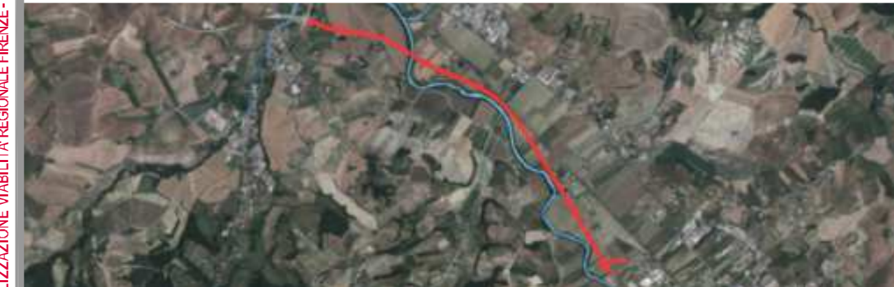
CARTELLA VP - Progetto stradale Viabilità Principale