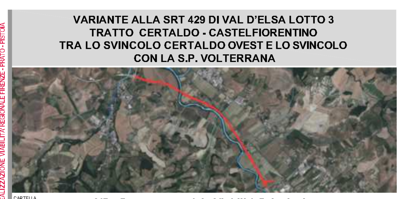
VARIANTE ALLA SRT 429 DI VAL D'ELSA LOTTO 3 TRATTO CERTALDO - CASTELFIORENTINO TRA LO SVINGOLO CERTALDO OVEST E LO SVINGOLO CON LA S.P. VOLTERRANA

REGIONE TOSCANA ASSESSORATO INFRASTRUTTURE, MOBILITÀ, URBANISTICA E POLITICHE ABITATIVE DIREZIONE REGIONALE DELLE OPERE PUBBLICHE SETTORE PROGETTAZIONE, REALIZZAZIONE, URBANISTICA E POLITICHE ABITATIVE