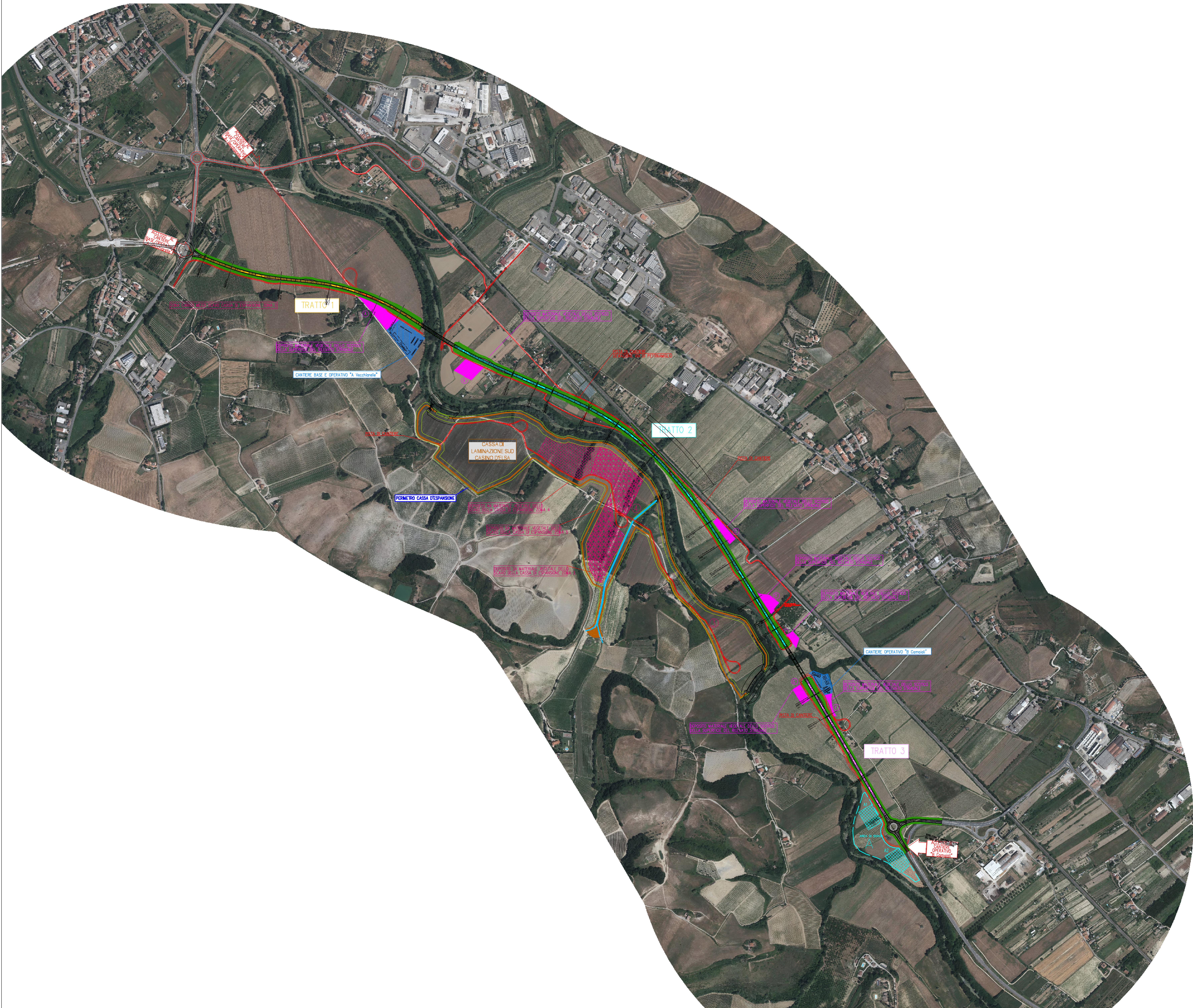
CANTIERE BASE E OPERATIVO "A VECCHIARELLE" / 1:1000